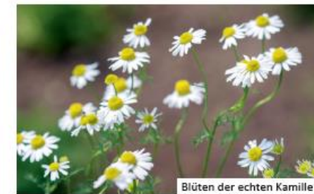
Blüten der echten Kamille

gebietsfremdes Kanadisches Berufkraut ( Erigeron canadensis ) oder heimisches Scharfes Berufkraut ( Erigeron acris ): beide haben jedoch kürzere Blütenblätter verschiedene Kamillen (Hundskamillen, Echte Kamille, Strandkamille): breite und weniger zahlreiche Blütenblätter sowie geteilte Blätter