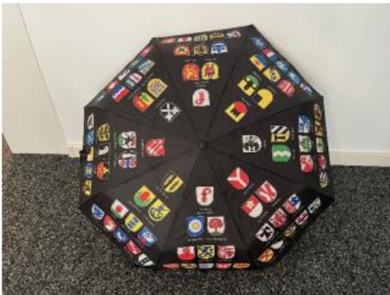
Ansicht aussen: 86 Gemeinden mit Wappen

Schirm mit den Wappen aller Gemeinden im Kanton BL (Knirps®)