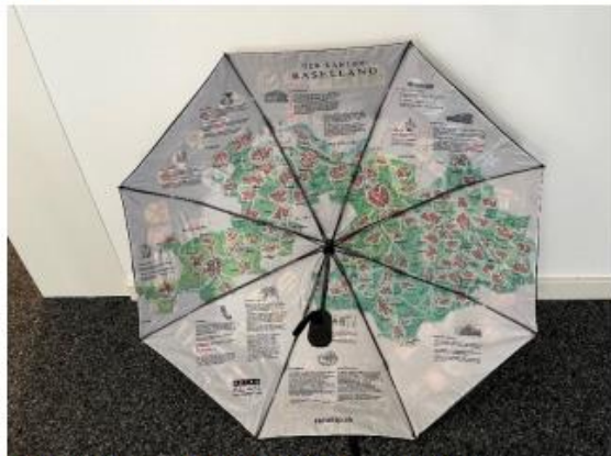
Ansicht innen: Karte Basel-Landschaft

Dieser originelle Schirm kann auf der Gemeindeverwaltung zum Preis von 40.00 CHF bezogen werden. «S' het solang s'het».