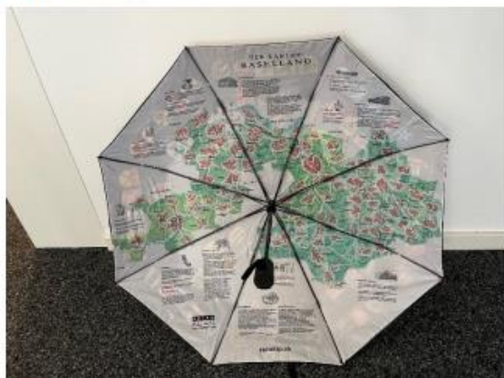
Ansicht innen: Karte Basel-Landschaft

Dieser originelle Schirm kann auf der Gemeindeverwaltung zum Preis von 37.60 CHF bezogen werden. «S' het solange s'het».