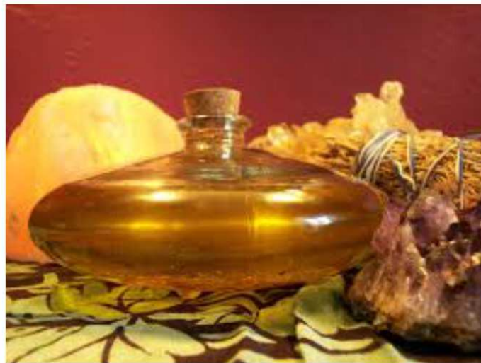
Pfarrerin Sonja Wieland

Sonja Wieland, Seraina Berger und Fabian vonDungen möchten Sie gerne einladen zu einem einfachen Salbungsgottesdienst in welchem Sie sich entspannen und für einen Moment aus dem Tagesgeschäft heraustreten dürfen.